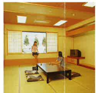
▲カラオケルーム“メロディー”

団らんや小宴会にぴったりの15畳。予約にてご利用いただけます。 ●1時間1,000円