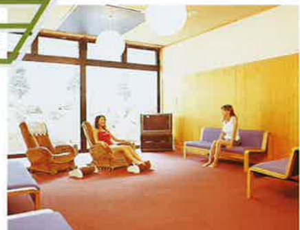
▲湯上がりコーナー